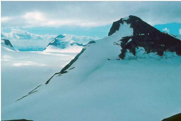
Suliskongen och Salajeknaglaciären i Sulitelma

När våren och sommaren kommer längtar både samer och fjällvandraren till fjällen. Detta bildspel skildrar stämningsfullt längtan till, resan till och upplevelser i de svenska fjällen. Bildserien börjar med en snabbropsodi genom vårt land upp till fjällen – i första hand Sulitelma, Sarek och Argjeplogsfjällen. Bilderna visar landskap i stort och smått, växter, samer och samekultur. Ljudet består av musik, lyrik och fågelsång. Vid dubbeltimma visas som inledning ett informativt bildprogram om fjällens natur. Bildspel (övertoning och ljud) och bildprogram med tal. Enkel och dubbeltimma.