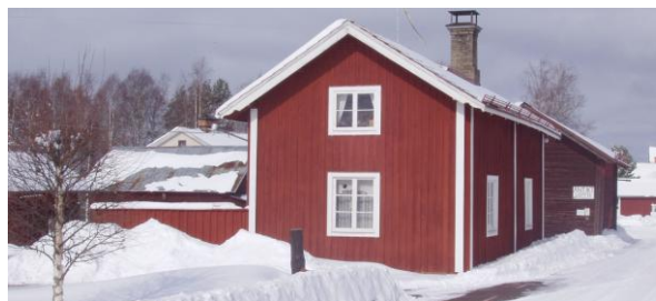
Min gård i Övre Gärdsjö