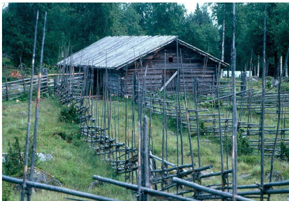
Ärtärasens fäbod i Rättvik

Dalarna är ett stort mångfacetterat landskap med vacker natur som skiftar från fjäll i norr till jordbrukslätter i söder. Däremellan finns de klassiska turistområdena kring Siljan som både ur natur- och kultursynpunkt är hjärtat av Dalarna. Trots omfattande turistexploatering ända sedan slutet av 1800-talet är Dalarna det landskap som bäst bevarat sin gamla kultur. Här finns Zorns och Carl Lars-sons miljöer i stort sett bevarade. Bildprogrammet visar några provbitar från detta fantastiska landskap. Bildprogram med övertoning och tal. Dubbeltimma.