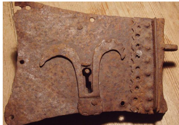
Dörrlås från medeltiden