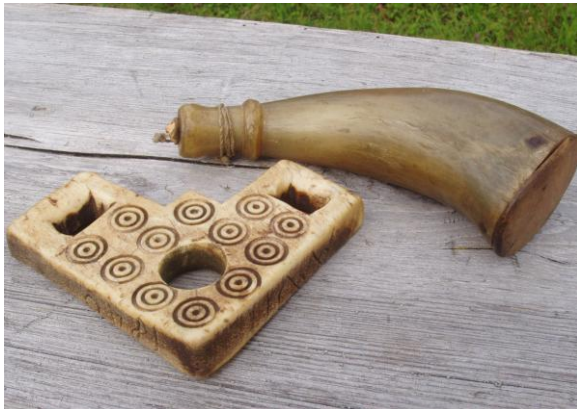
Selknä daterat 1840 och kruthorn

Visning av gamla saker, tal. Dubbeltimme.