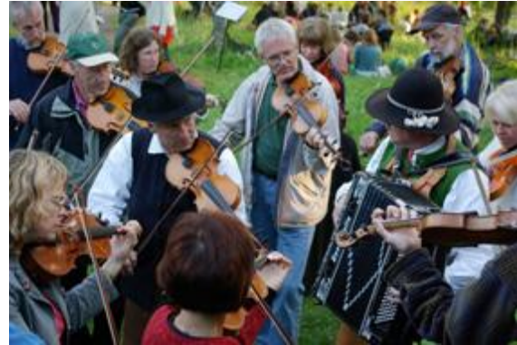
Spelmansstämma i Boda, Rättvik