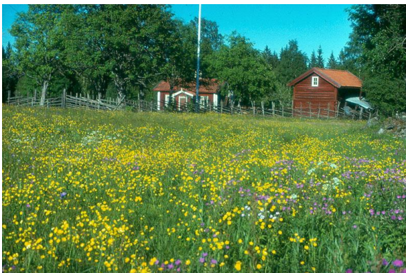
Luossastugan i Skattlösberg