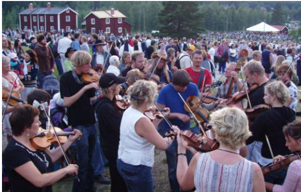
Spelmansstämma i Bingsjö, Rättvik