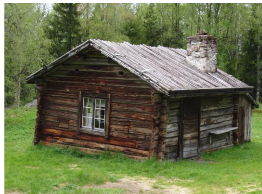
Bräntjärnstorpet – Dan Anderssons fars hem