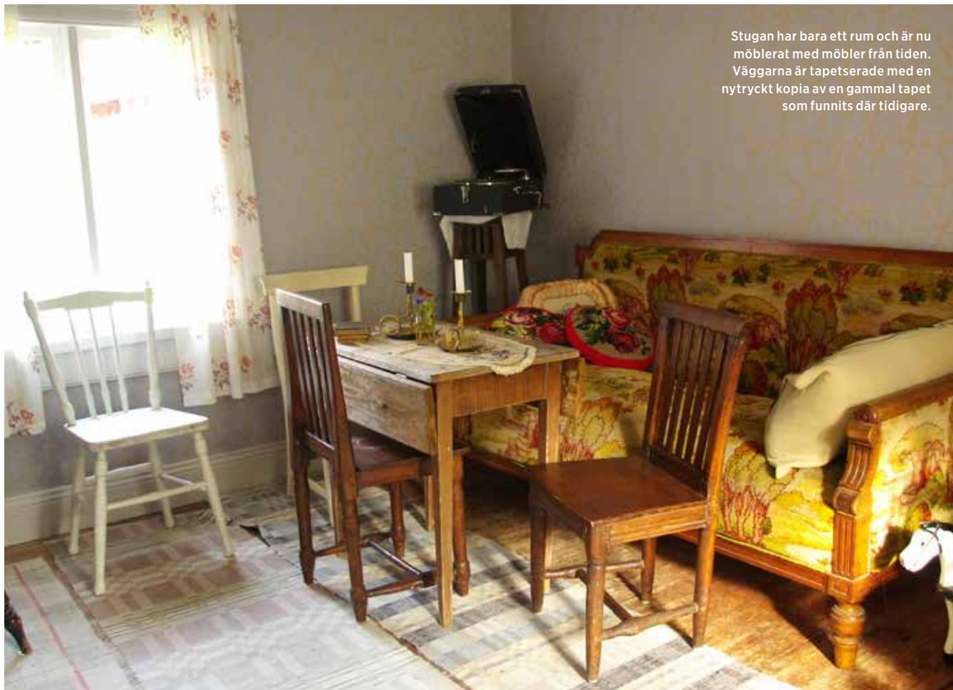
Stugan har bara ett rum och är nu möblerat med möbler från tiden. Väggarna är tapetserade med en nytryckt kopia av en gammal tapet som funnits där tidigare.

”De där tegelpannorna du söker efter har du gått förbi hela ditt liv. Jag har 800 stycken.”