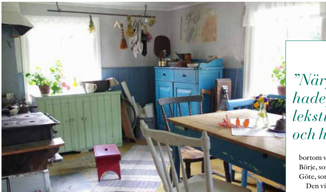
Köket i gamla stugan har med lerklining, målning och gamla möbler fått ungefär samma utseende som det hade när Dan Andersson var här och målade. På väggen ovanför det blå skåpet syns det utsparade partiet där han skrivit 1920.