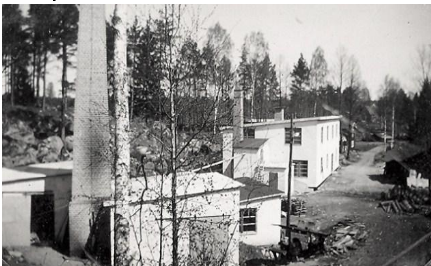
Ekens fabrik, den s k täckfabriken, i Örseryd, troligen någon gång under 1940-talet.

Ekens verksamhet i Karlshamn hann knappt börja för 1938-39 dämde Frank upp bäcken, byggde en damm samt ny fabriksbyggnad och kraftverk. Verksamheten flyttade dit och man kardade lump till stoppning av täcken och madrasser. Under krigsåren kompletterades med diverse andra material som tagel och sågspån i madrasserna. Det blev den s k täckfabriken vilken sysselsatte en del ortsbor.