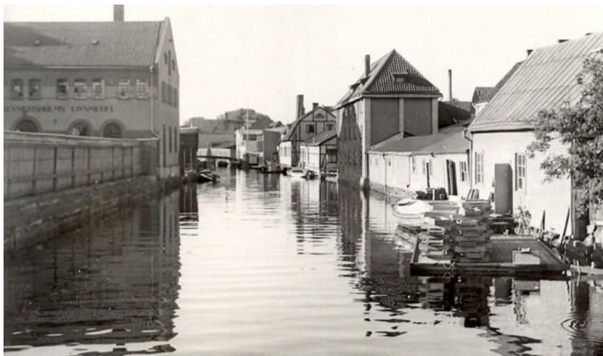
Mieån och Ekens fabrik i Karlshamn. Fabriksbyggnaden är det höga huset med valmat tak till höger om ån.