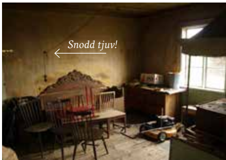
I sängen i bagarstugan under lampan sov Pellas Hans till cirka 1978.

Den nordsvenska gården kännetecknas av ett enkelt kringbyggt gårdsrum. Illustration Sven Olsson. Ur Byar och fäbodrar i Rättviks kommun. Kulturhistorisk miljöanalys av Roland Andersson, Dalarnas museum, 1987.