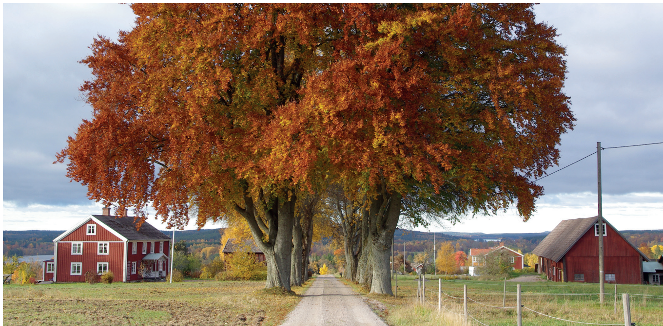
Genom Historiska kartor och dess underavdelningar Alfabetiska och Kronologiska registret kan man få veta mycket om torp och gårdar i byarna. Här en vy från Nykulla i Tjureda socken.

en förteckning över akter från den byn ända från de första skiftena under 1700-talet fram till 1980-talet. I samma sökträff ligger också akter från andra byar i samma socken. Vet man fastighetsbeteckningen så ser man vilka akter