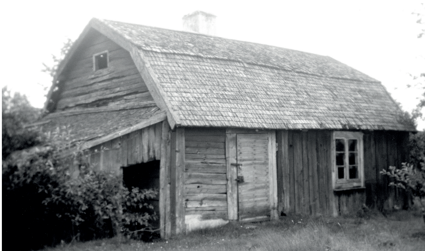
Detta är den gamla stugan på torpet Dalen i Källreda i Tolgs socken. Bilden är unik för stugan revs någon gång efter 1964. Den fanns då när Ingemar Bjersing fotograferade den från andra sidan till Tolgboken.