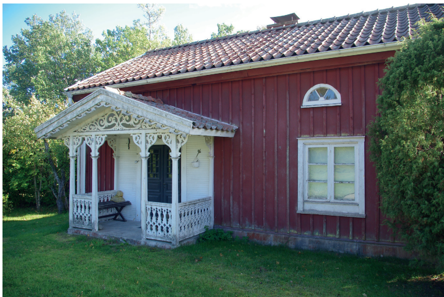
Kanske kan ett gammalt inlösningskontrakt berätta mer om torpet Dalen i Källreda i Tolgs socken.