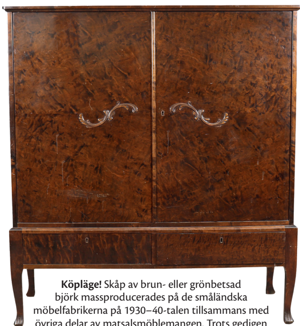
Köpläge! Skåp av brun- eller grönbetsad björk massproducerades på de småländska möbelfabriker på 1930–40-talen tillsammans med övriga delar av matsalsmöblemangen. Trots gedigen hantverkskvalitet är de inte så uppskattade idag. Detta skåp, längd 124 cm, med lite skavningar gick för endast 250 kr (600 kr) på Täby Auktionsbyrå 2019.