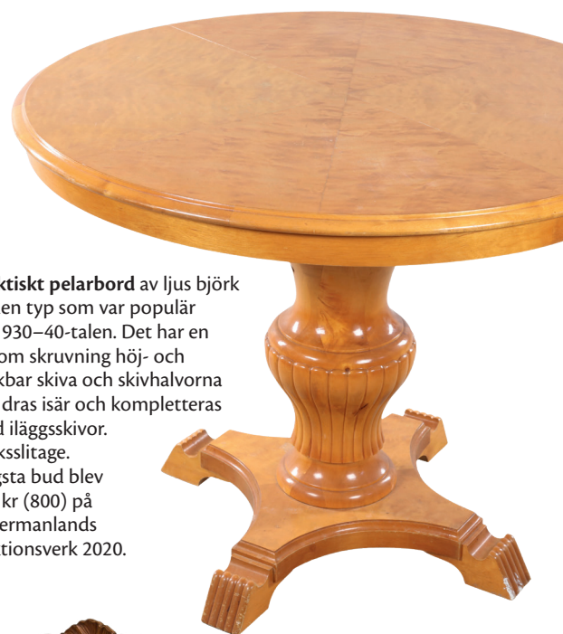
Praktiskt pelarbord av ljus björk av den typ som var populär på 1930–40-talen. Det har en genom skruvning höj- och sänkbar skiva och skivhalvorna kan dras isär och kompletteras med iläggsskivor. Brukslitage. Högsta bud blev 250 kr (800) på Södermanlands Auktionsverk 2020.