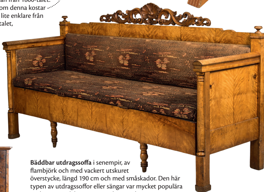
Bäddbar utdragssoffa i senempir, av flambjörk och med vackert utskuret överstycke, längd 190 cm och med småskador. Den här typen av utdragssoffor eller sängar var mycket populära under senare delen av 1900-talet men kostar nu, som på Helsingborgs Auktionskammare 2017, bara 350 kr (1 500 kr).