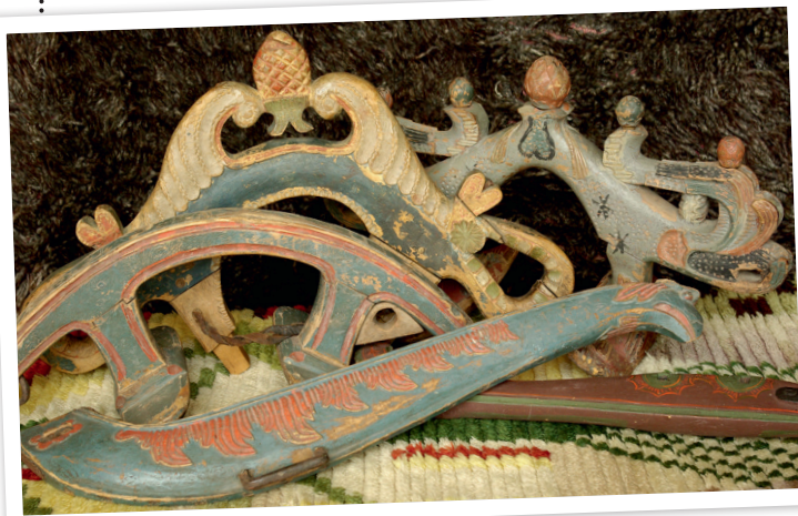
Som smycken. Seldon för hästen tillverkades ofta av björk. Dessa vackert skurna och målade selbågar och lokor kommer från Uppland. Privat ägo.