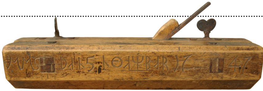
Hyvel av björk daterad 1747, skuren med runor, troligen från Älvdalen i Dalarna. Det är där man hittar föremål med runinristningar från 1500- till 1800-talen. Texten lyder uttydd: MMS (Mats Matsson) den 5 november 1747. Privat ägo.