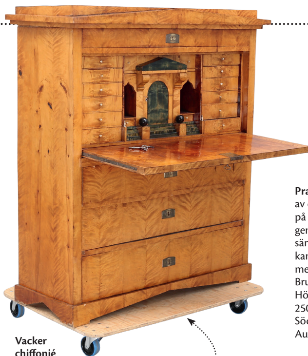
Vacker chiffonjé av flambjörk i Karl-Johan från 1800-talet. Exklusiva chiffonjéer som denna kostar fortfarande medan de lite enklare från andra halvan av 1800-talet, som på 1980-talet i Småland kunde kosta 2 000–3 000 kr, går idag för 300–400 kr. Denna klubbades för 7 250 kr (2 000) på Växjö Auktionskammare 2020.

Pinnstolen kom till Sverige från USA på 1850-talet. Det är en speciell möbel som var mycket populär under andra halvan av 1800-talet och i andra modeller långt in på 1900-talet. Pinnarna i rygg och ben svarvades alltid av björk. Ytan var oftast betsad eller målad i bruna nyanser. Tillverkningen var i huvudsak förlagd till de småländska möbelfabriker.