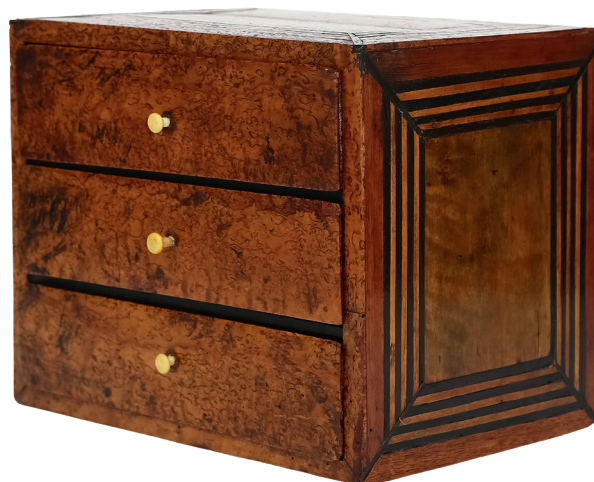
Dekorativt arbete. Schatull från 1700-talet av masurrot med intarsia, längd 25,5 cm. Det klubbades för 1 903 kr (1 500) på Kalmar Auktionsverk 2017, med torrsprickor, ålder- och brukslitage.