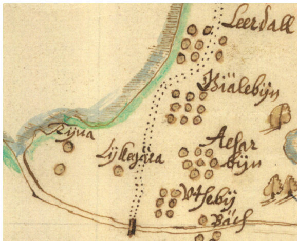
Utsnitt ur Geografisk avritning av Rättviks socken 1668 av Jöran Holstensson.

Kumblaenius skriver i sin krönika 1764 under Byarnas namn: Lyckgärdet, öde 1731, hade 3 gårdar, låg 1/4 mil ifrån Tina emellan Utby och Tina på högra handen om vägen då man far till Leksand . Detta stämmer vad gäller antalet gårdar överens med husförhörslängderna men inte att byn var öde 1731, se nedan.